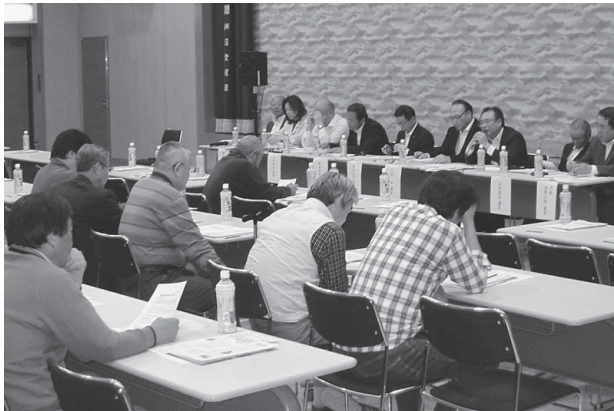
【とき】 5月26日(土) 19時～ 【ところ】交流ターミナルセンター 【参加者】32名