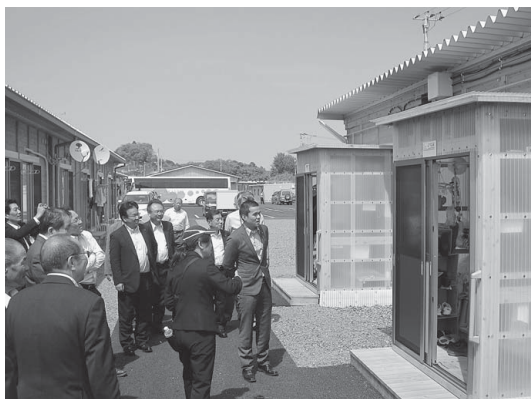
避難所生活を視察【いわき市】

【用語説明】 ※趣旨採択 願意は妥当であるが、実現性の面で確信がもてないといった場合に、不採択とすること もできない請願や陳情に対する決定の方法